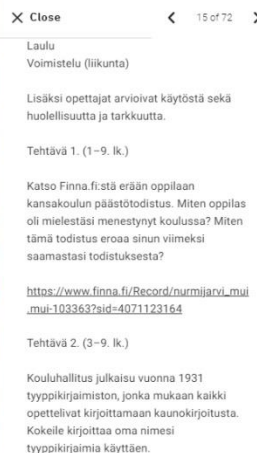
Kuva 5 Valkopohjainen kortti näkyvillä.