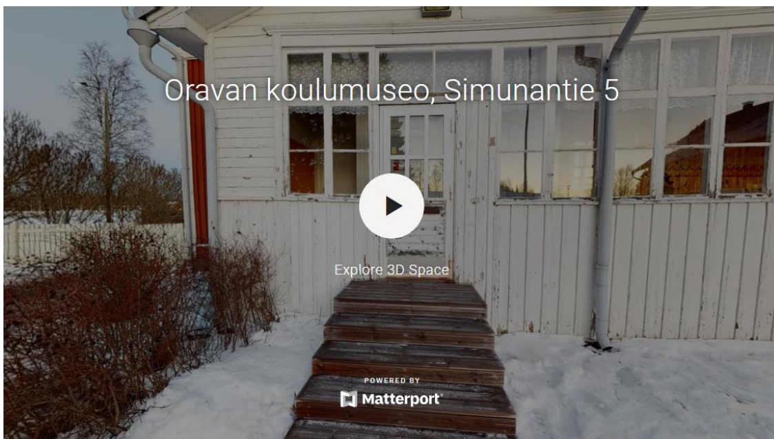
Kuva 1 Matterport- ikkuna ja keskellä oleva play- nappi.

Klikkaa keskellä olevaa play-nappia käynnistääksesi virtuaalinäyttelyn (Kuva 1).