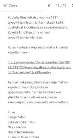
Kuva 6 Ihan alimmaisena kortissa nähtävillä kuvana olleen taideteoksen tiedot.