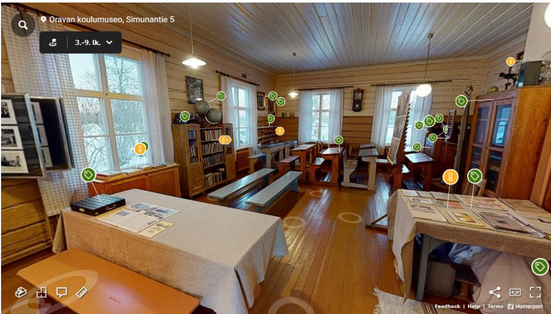
Kuva 3 Museon sisällä. Esine- sekä teksti- ja tehtäväpallerot ovat näkyvillä.

Näyttelyyn on sijoitettu sopiviin paikkoihin esinepalleroita (vihreät lapun kuvalla) sekä teksti- ja tehtäväpalleroita (keltainen huutomerkkin kuvalla) (Kuva 3).